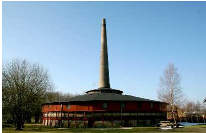
Nivågård Teglværks Ringovn

bondeteglværk, der fra 1701 leverede mursten til de kongelige slotte i Nordsjælland, bl.a. til dronning Louises ombygning af jagtslottet Hirschholm Deltagelsen er gratis og alle er velkomne, men af pladshensyn er tilmelding nødvendig. Nærmere herom vil tilgå forinden.