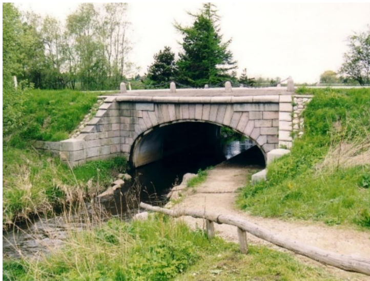
Jelle Bro mellem Nivå og Kokkedal

Torsdag 30. april kl. 19.30-21.30 - Foredrag