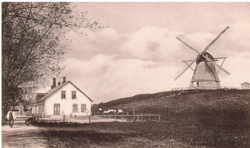
Karlebo Mølle ca. 1910