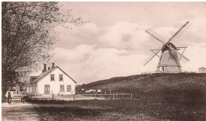
Karlebo Mølle ca. 1910